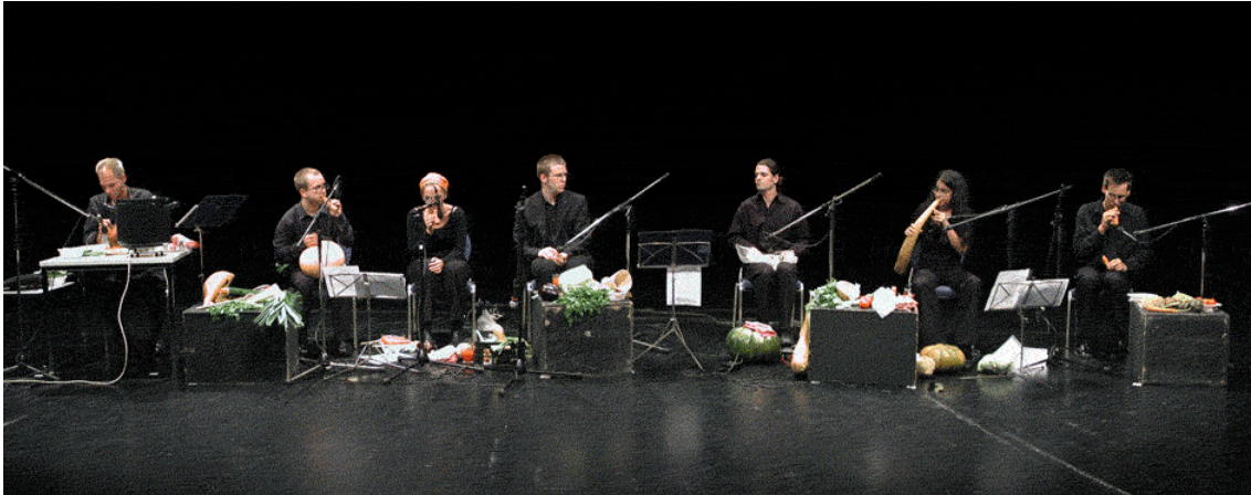
"Les idées sonores marinées et les habitudes d'écoute en conserve ont besoin d'être rafraîchies".

En janvier 1998, neuf autrichiens décident de fonder THE VIENNA VEGETABLE ORCHESTRA ; un orchestre végétal, avec pour seuls instruments : des légumes creusés, taillés, sculptés et, précisent-ils, de première fraîcheur pour une solidité et un son parfaits. Véritables designers sonores et sculpteurs de légumes, ces musiciens produisent de la musique uniquement à partir de végétaux. Salade, concombre, citrouille, poireau, tomate... Autant de légumes qui peuvent émettre un son.