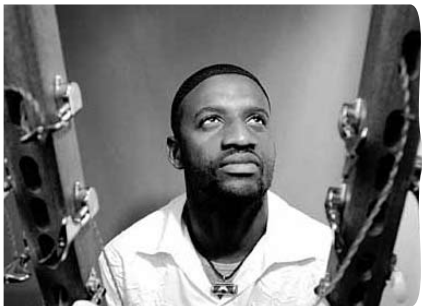
Figure emblématique de la musique réunionnaise, René Lacaille nous transporte sur les îles créoles avec toute l'inventivité, la joie de vivre et aussi la mélancolie qui les caractérisent. Habituellement sur scène avec son groupe, il propose aussi cette année une collaboration exceptionnelle avec FANTAZIO. Fantazio, l'homme contrebasse, le nomade urbain, invite René Lacaille à entrer dans sa boîte de jazz-rock. Une cuisine musicale épicée, un voyage sans retour dans les sons, une équipée explosive comme les aime chacun de ces deux musiciens détonnant, avides des autres et fous de scène.